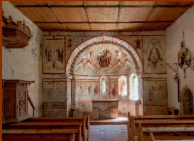
St. Helena am Wieserberg

Für gehbeeinträchtigte Personen kann bei Anmeldung bis Donnerstag vor der Veranstaltung ein Transport organisiert werden. Tel. 04718/301